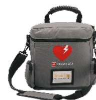
Övningsmaskin med väska