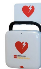
Hjärtstartare med handtag och väggfäste